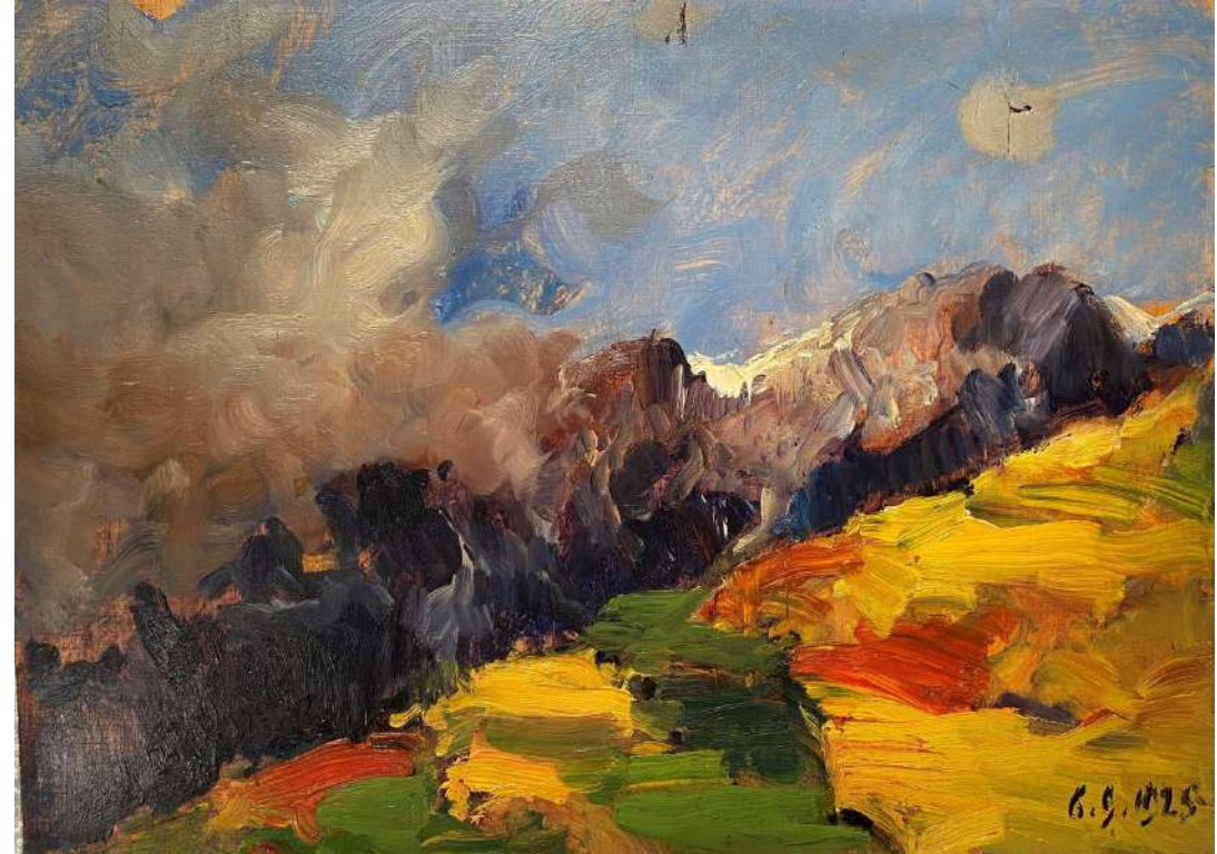
Giuseppe Augusto Levis, Roccia e nevi tra nubi e azzurro , 1925, inv. 873

Così come il colore invade i dipinti di Levis, il succo delle more che circondano (e lentamente prendono possesso) la Villa del Cajre di Racconigi, diventano la tinta impiegata dal collettivo Vaste per creare immagini fotografiche degli spazi delle antiche dimore dell'artista.